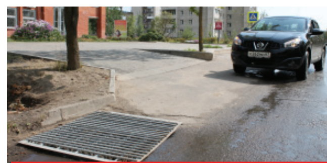
Эту ливневку на улице Автозаводской возле Россельхозбанка нашли только с помощью...миноискателя. И не зря. Теперь она успешно справляется с любыми потоками дождевых вод.

Более месяца напряженного людского труда и специальной техники потребовалось «Чистому городу», чтобы вновь наладить работу ливневой канализации. Сейчас при дожде любой интенсивности вода не застаивается на проезжей части и не создает серьезных помех для движения автотранспорта и пешеходов. Болота и озера на этих участках улиц ушли в прошлое.