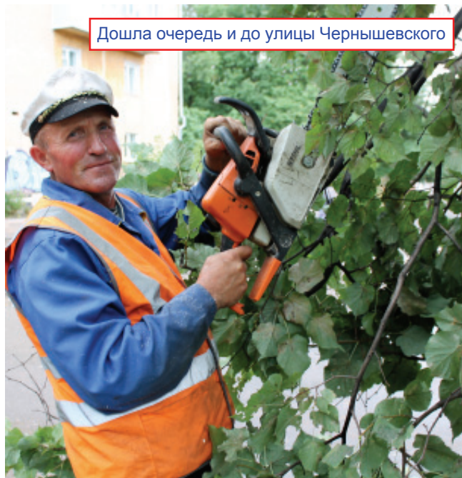
Дошла очередь и до улицы Чернышевского

Для предприятия «Чистый город» праздник города Ярцева является поводом не только для радости, но и для подведения итогов выполненной работы по благоустройству