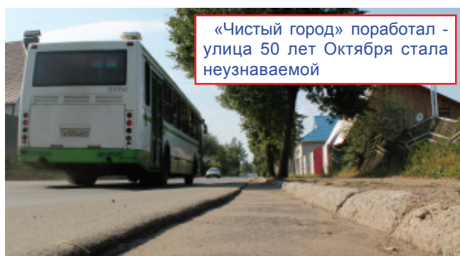
«Чистый город» поработал - улица 50 лет Октября стала неузнаваемой

той «Чистый город» занимался чисткой обочин и вывозом скопившегося мусора. Теперь дороги выглядят как широкополосные проспекты, их ширина во многих местах увеличилась на три метра.