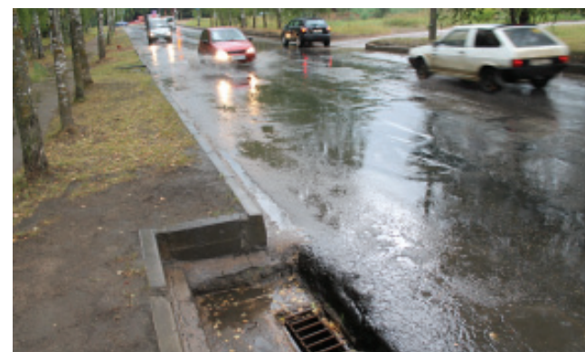
На этом месте возле бассейна много лет после дождей образовывалось настоящее озеро. Теперь вода спокойно уходит в ливневку.