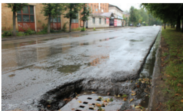
Еще одно зловещее озеро исчезло с улицы Ленинской благодаря стараниям «Чистого города»