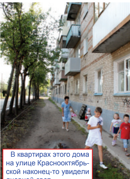
В квартирах этого дома на улице Краснооктябрьской наконец-то увидели дневной свет

Многие годы обрезкой деревьев в Ярцеве никто не занимался. Последний раз причёску на липах, кленах и ясенях наводило муниципальное предприятие «Дорожник». Было это лет 7-8 назад. Многие ярцевчане еще помнят, как после такой стрижки деревья оставались вообще без кроны. После обрезки они превращались в двухметровые столбики. Предприятие «Чистый город» культивирует крону бережно, удаляя только те ветви, которые мешают обзору водителей, лезут в электропровода или окна квартир. Так, после обрезки веток жители дома по улице Краснооктябрьской наконец-то увидели свет в окне, и сказали «Чистому городу» спасибо.