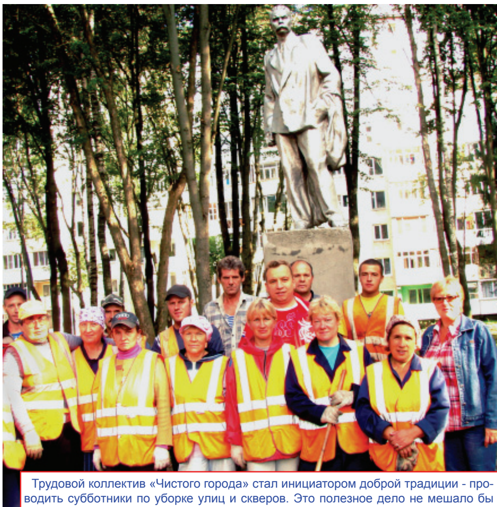
Трудовой коллектив «Чистого города» стал инициатором доброй традиции - проводить субботники по уборке улиц и скверов. Это полезное дело не мешало бы перенять и другим предприятиям и горожанам.

поливочные машины, трактора со щетками для подметания улиц, автогрейдер, автовышка, машины для ямочного ремонта и даже агрегат, выполняющий подметально-уборочные функции, прозванный в коллективе «пылесосом».