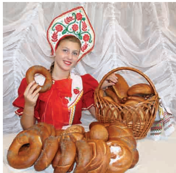
Коллектив ООО «Ярцевский хлеб»

Наш город родной, Мы тебя поздравляем! Тебе всей душой Процветанья желаем. Спешим развиваться, На месте не стоим, Мы любим тебя И гордимся тобой! А всем горожанам Желаем веселья, Чтоб стали богаче И жили дружнее! Спокойствия всем Под безоблачным небом, Столбов изобильных С ярцевским хлебом!